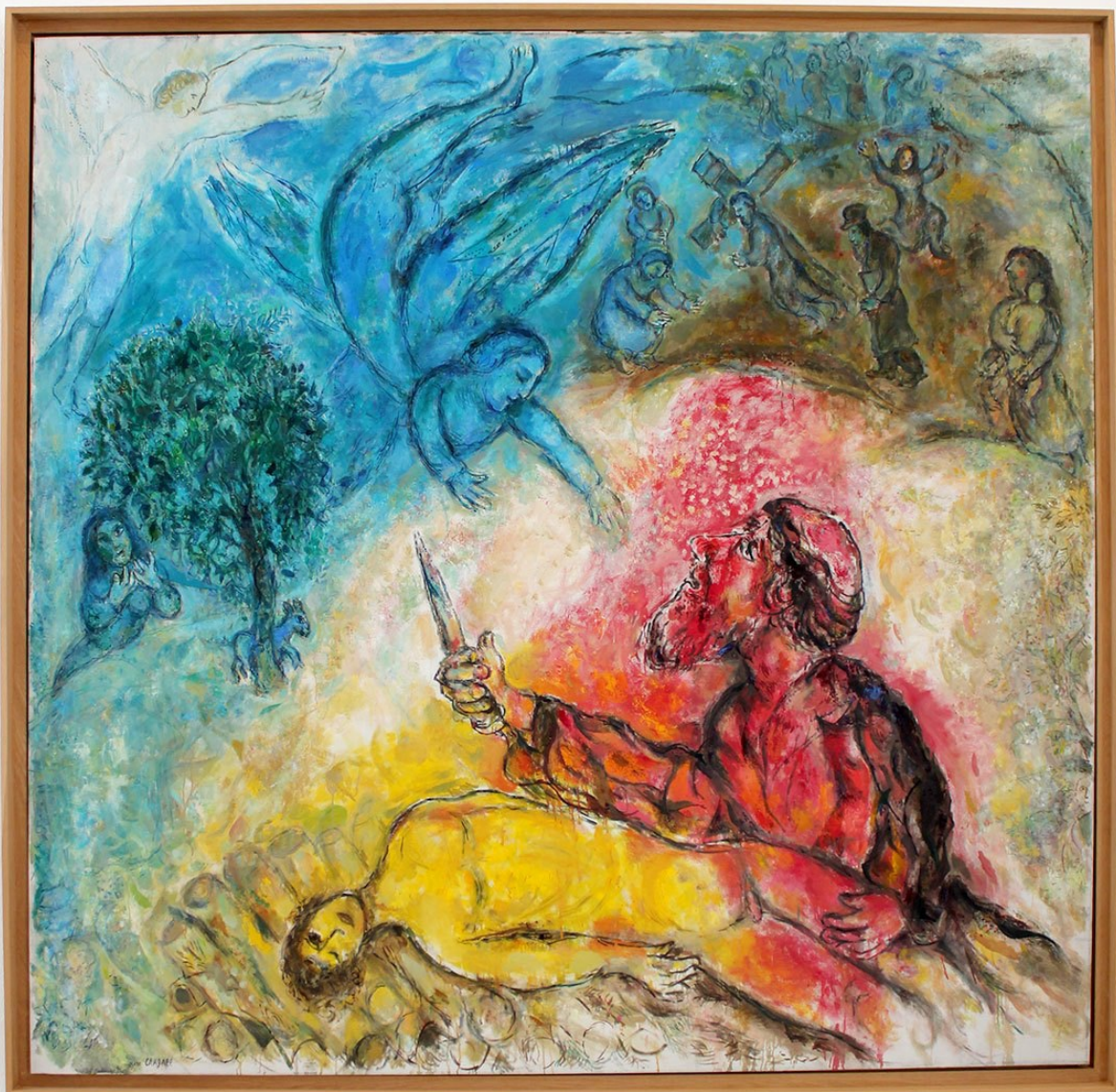
Nice Musée Chagall – Le sacrifice d'Isaac (1960-66).