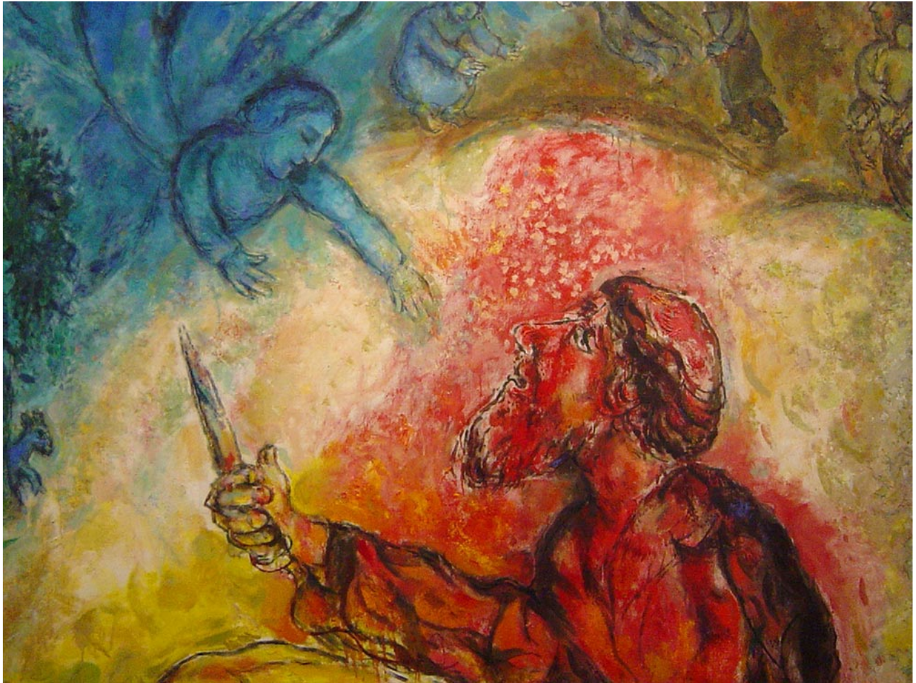
Chagall Museum Paintings, Nice, France.

Похоже, это толкование было широко распространено в Средние века: